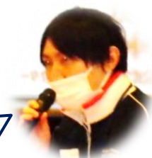
日本赤十字 指導員

119番通報してから救急車が到着するまで、全国平均は「9分弱」です。その場に居合わせた人によって胸骨圧迫・AED使用がいち早く行われることが、その後の救命率に大きく影響します。AEDの設置場所を知っておくことも心停止の予防に役立ちます。緊急時は、大声で協力者を集め、多数で救助に当たることが大切です。